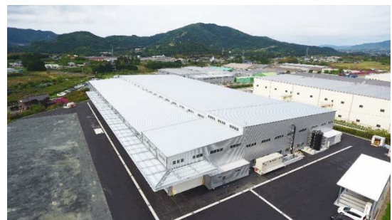
新城工場 敷地面積: 約 27,000 m 2