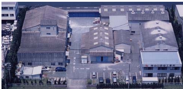
豊橋工場 敷地面積: 約 5,000 m 2